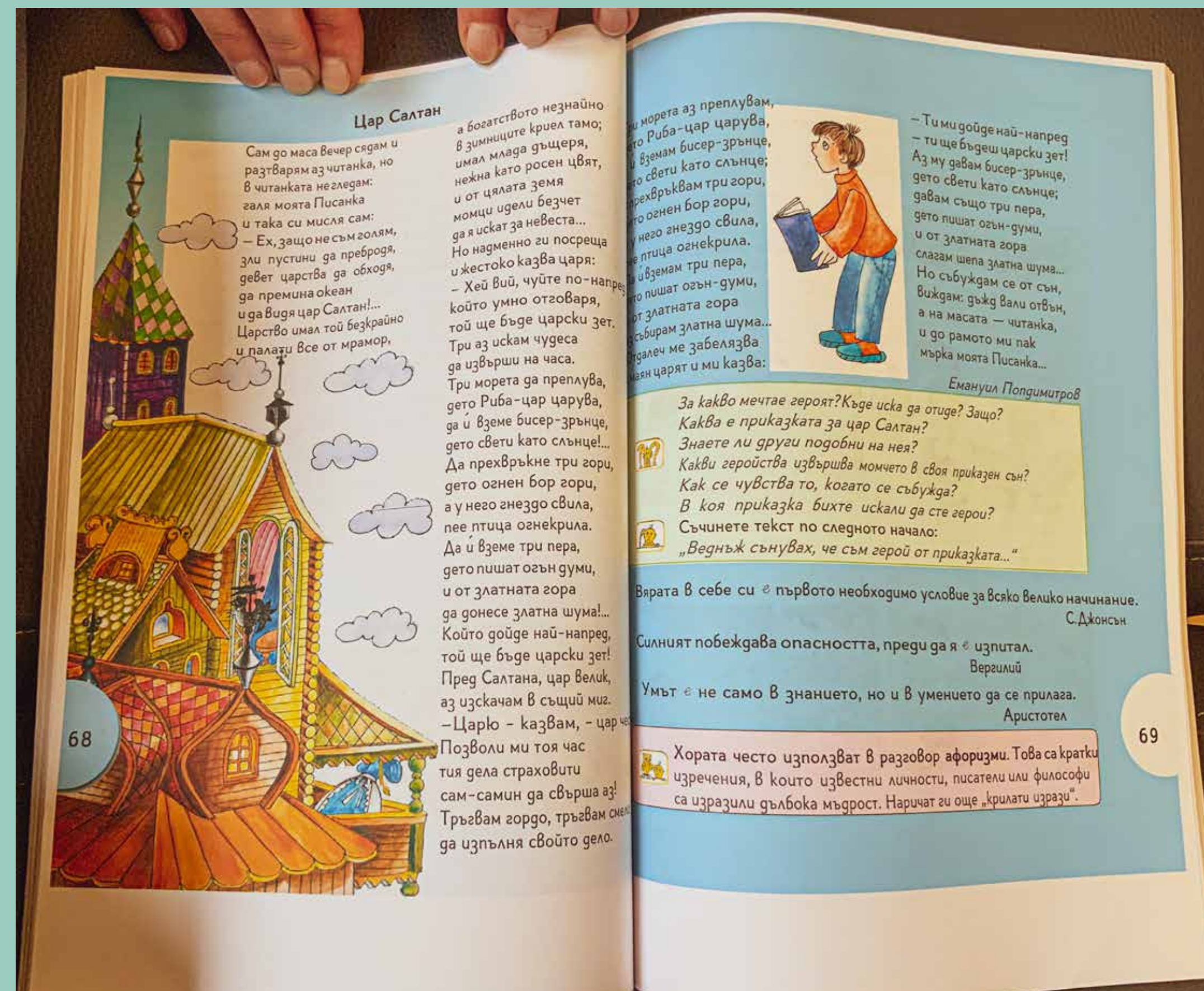
Два разтвора от учебник "Читанка" за 4. клас на изд. Просвета, преформатирани с шрифт Adys от г-р Яръмова.